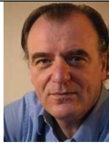
Alain BRON, écrivain