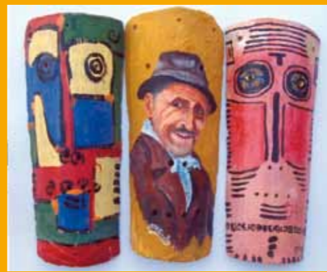
Guy Chambon « Dans la vallée des masques ». Acrylique sur tuile.